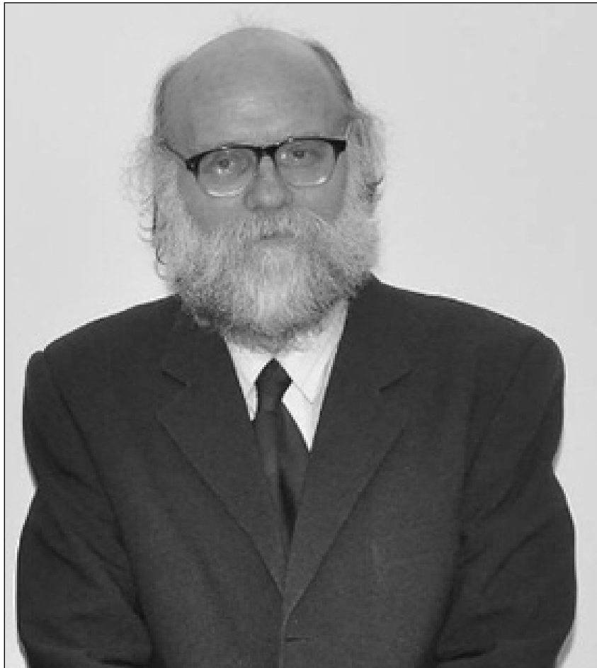
Acad. Mihail-Viorel Bădescu – inginer Membru titular al Academiei Române din 2017 (corespondent – 2011)