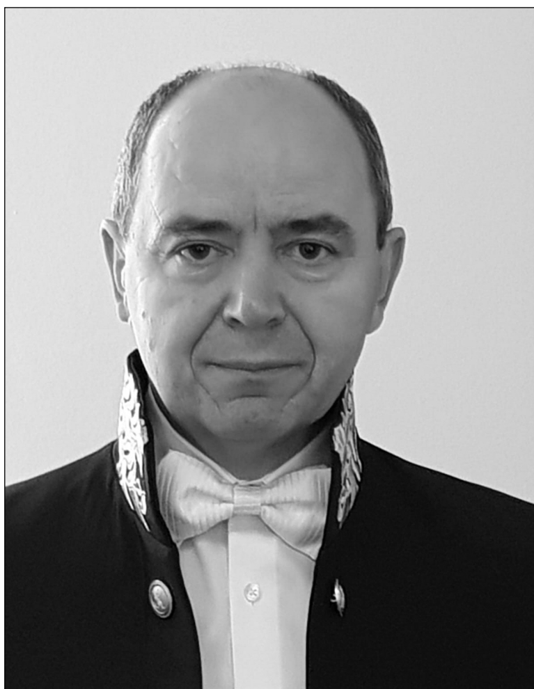
Profesor universitar, cercetător – istoric Membru corespondent al Academiei Române din 2018