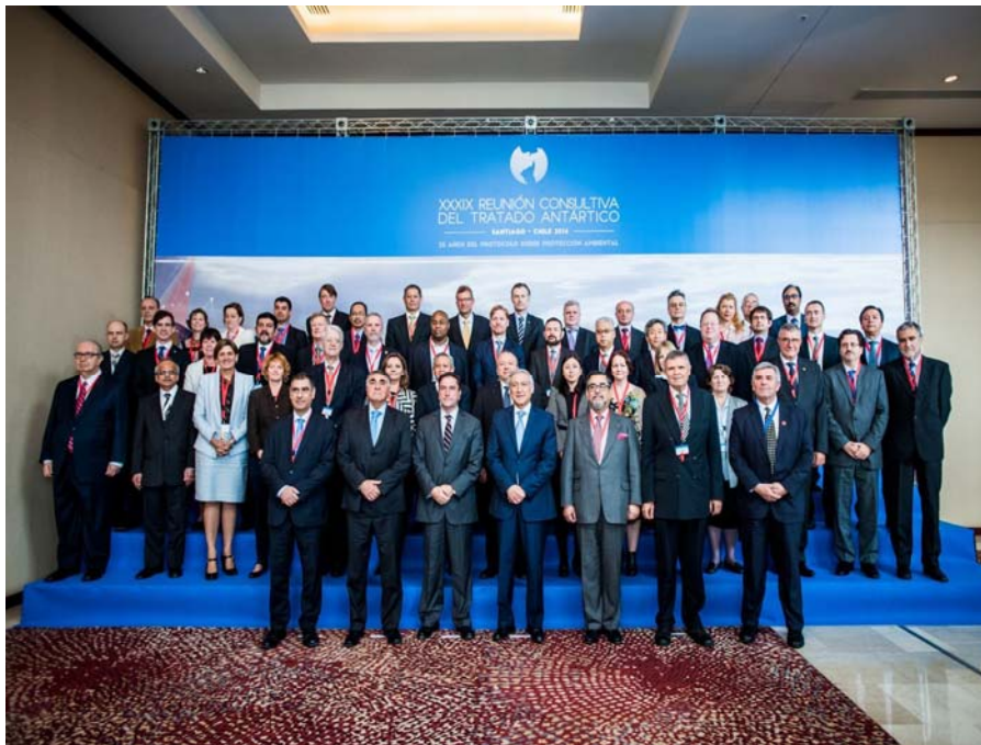
Șefii delegațiilor naționale la ATCM 39 - CEP 19, 2016, Santiago, Chile – la deschiderea oficială a lucrărilor reuniunii, 23 mai 2016.

Această propunere a fost făcută în lumina celebrării a 25 de ani de la semnarea Protocolului de la Madrid (în cadrul Agenda Item 18. 25 th Anniversary of the Protocol on Environmental Protection ).