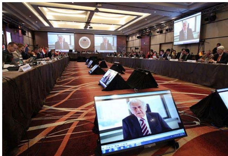
Mesajul video al fostului Premier al Australiei, Bob Hawke, care, împreună cu fostul Premier francez Michel Rocard, a inițiat campania care a condus la semnarea Protocolului de la Madrid (1991)